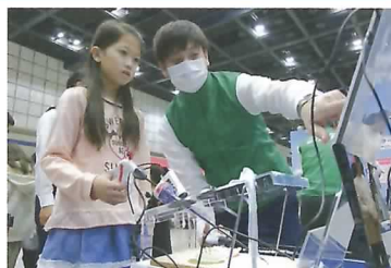
腹腔鏡手術のトレーニング