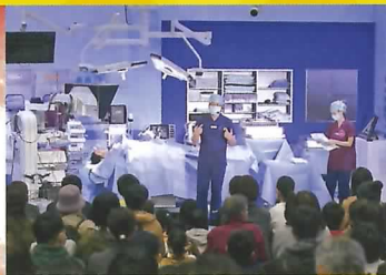
会場内にオペ室を再現! 腹腔鏡手術の実演