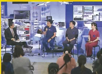
医療チームの一員になろう! 情熱医療トークライブ