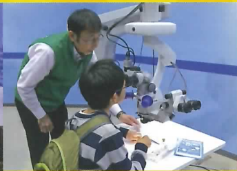
本物の医療機器に触れよう! 医療の仕事体験