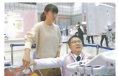
体の外から観察する超音波検査