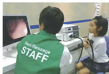
胃や大腸を観察する内視鏡の操作