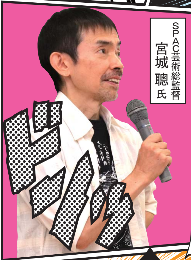
SPAC 芸術総監督 宮城 聰 氏