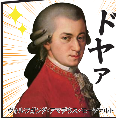
ヴォルフガング・アマデウス・モーツァルト