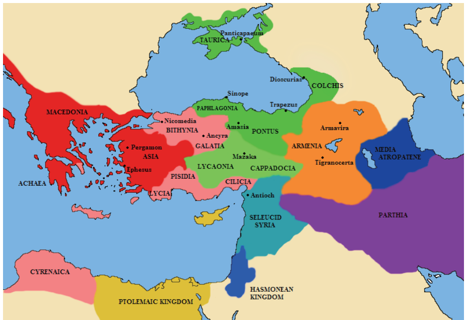
小アジアにあったポントス王国の国王 (在位：紀元前120年 - 紀元前63年)