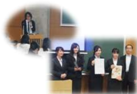
平成28年度 研究成果発表会の様子