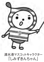
清水港マスコットキャラクター「しみずきんちゃん」

防災科学技術研究所上席研究員・南海トラフ海底地震津波観測網整備推進本部副本部長。海洋研究開発機構上席研究員としてクロスアポイントメント。博士(理学)。文部科学省「防災対策に資する南海トラフ地震調査研究プロジェクト」の課題「創成情報発信研究」の代表も務める。海底観測網の開発や即時津波予測の研究に従事。