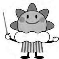
気象庁マスコットキャラクター「はれるん」